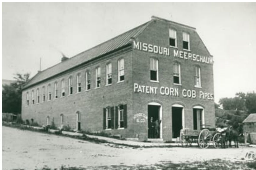
Fabrica de Tijolos de 1880.