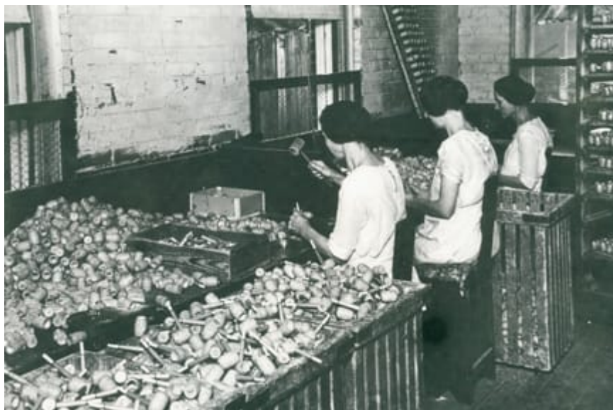
Trabalhadores fabricando Cachimbos na década de 1920.

“meerschaum” é derivada de uma palavra alemã que significa “espuma do mar”. Meerschaum é uma argila turca usada em cachimbos de alta qualidade. Tibbe comparou sua cor, forninho poroso e sua fumaça fria à dos cachimbos mais caros e cunhou o nome “Missouri Meerschaum” para seus cachimbos. Tibbe e um amigo químico inventaram um sistema inovador de aplicação de uma substância à base de gesso na parte externa dos forninhos do cachimbo de sabugo de milho. Em 1878, Tibbe patenteou este processo.