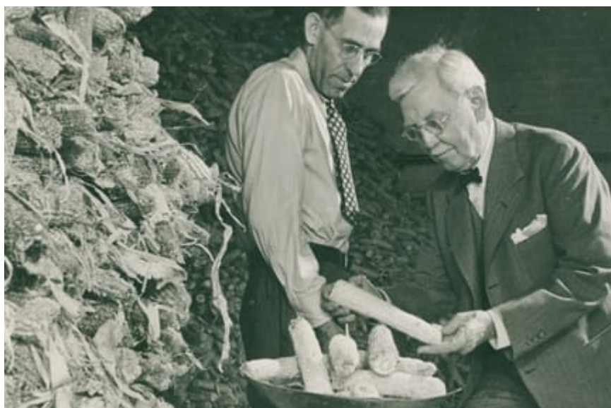
Proprietários da M. Meerschaum inspecionando os cachimbos, na década de 1940.