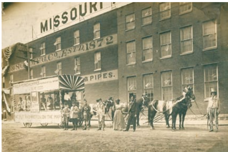
Carroça publicitária de 1914. Washington, MO Aniversário de 75 anos.

História baseada de acordo com o site da Missouri Meerschaum.