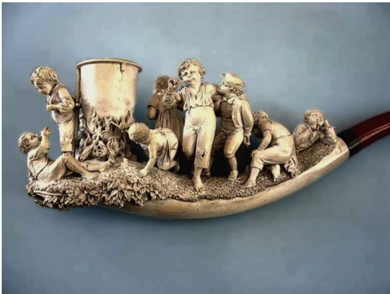
Tubo de Meerschaum Esculpido da Coleção de Tubos Peckus Dr. Sarunas "Sharkey" como visto em Colecionando Antigos Meerschaums por Ben Rapaport

Meerschaum, do alemão para "espuma do mar", é extraído de depósitos dos restos de esqueletos de criaturas marinhas microscópicas que se instalaram no fundo de antigos leitões marinhos e foram comprimidos ao longo de milhões de anos.