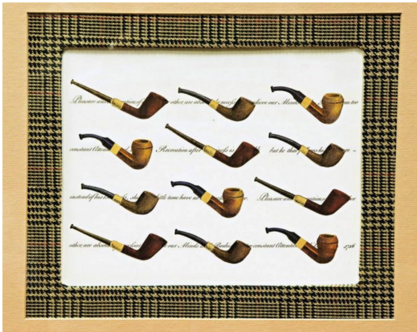
Desenhos de tubos vintage cortesia de Uptown